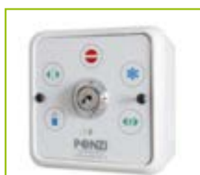
Selettore di funzione a chiave