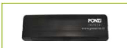
Sensore di sicurezza chiusura/apertura - infrarossi attivo