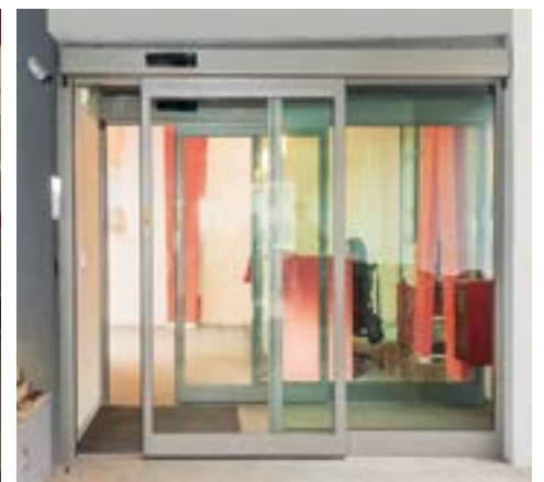
Bussola monoanta in edificio scolastico secondario