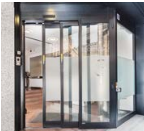
Ingresso agenzia / ufficio - ampio passaggio netto