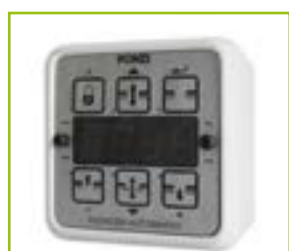
Selettore di funzione elettronico