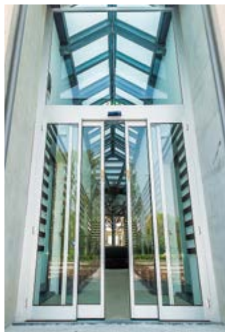
Sede bancaria con ante a schermatura blindata