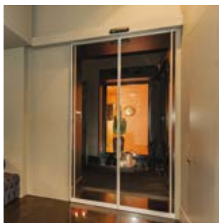
Hotel porta scorrevole AS4 con profili da 20 mm