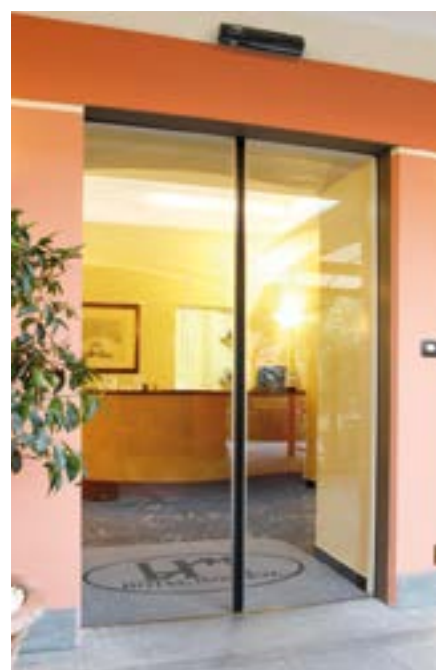
Automazione idonea per profili da 20 mm in Hotel