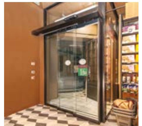
Porta telescopica ante versione "tutto vetro"