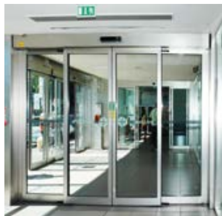
AS TOS per bussola di ingresso aeroportuale