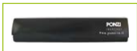
Sensore combinato sicurezza e movimento