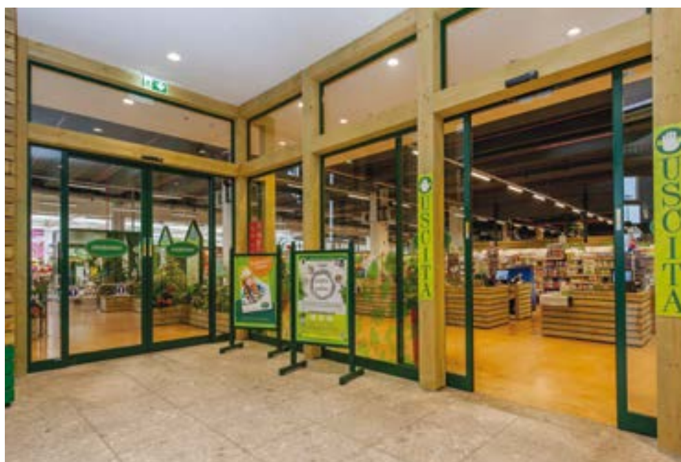
Automazione AS4 idonea per negozi di piccole e medie dimensioni, con ottima movimentazione e silenziosità