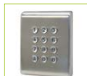
Tastiera numerica antivandalica