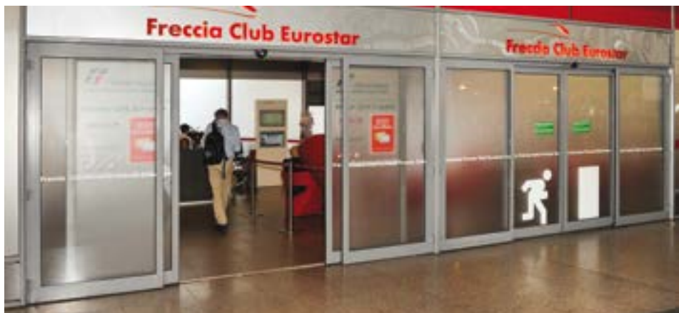
Bussola allineata porte scorrevoli automatiche AS3 TOS omologate uscita di sicurezza - Stazione Ferroviaria