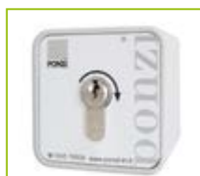
Selettore esterno a chiave