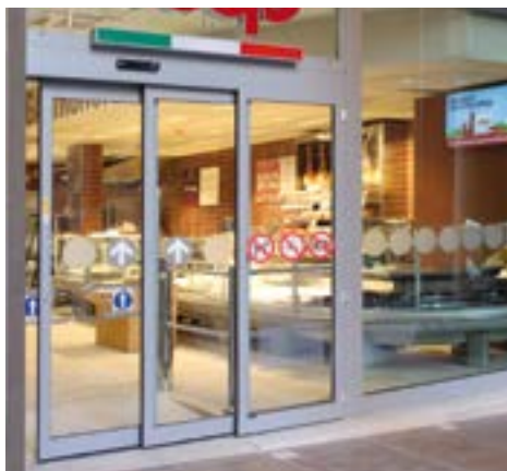
PONZI TSA per ingresso negozio e supermercato