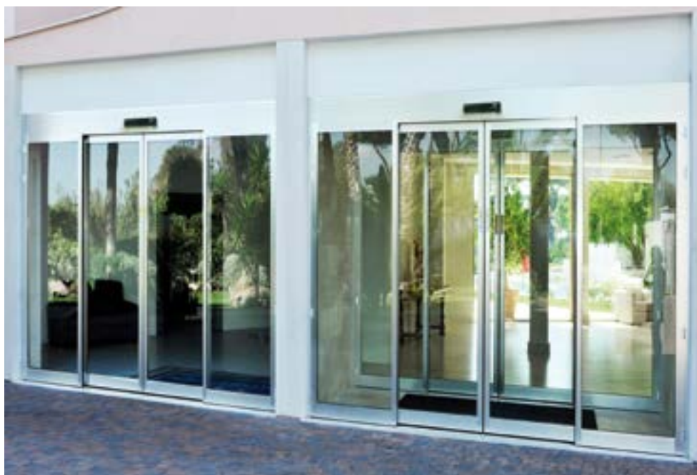
Bussola di ingresso uffici bancari con porte di altezza superiore ai tre metri e automazione potenziata AS MAX