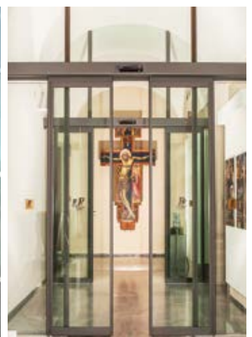
Porte di compartimentazione interna, sede museale