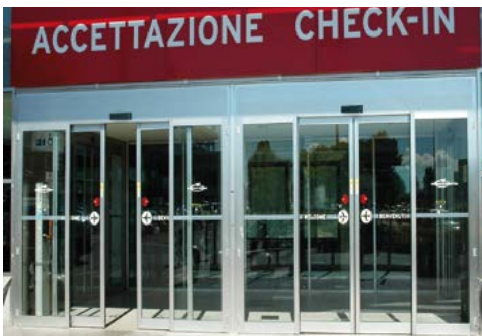
Automazione AS3 per porte a 4 ante dotate di dispositivo antipánico TOS in bussola di ingresso - Aeroporto