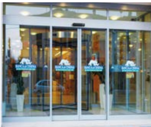
Ingresso con vetri di sicurezza, 170 kg per anta mobile - Banca