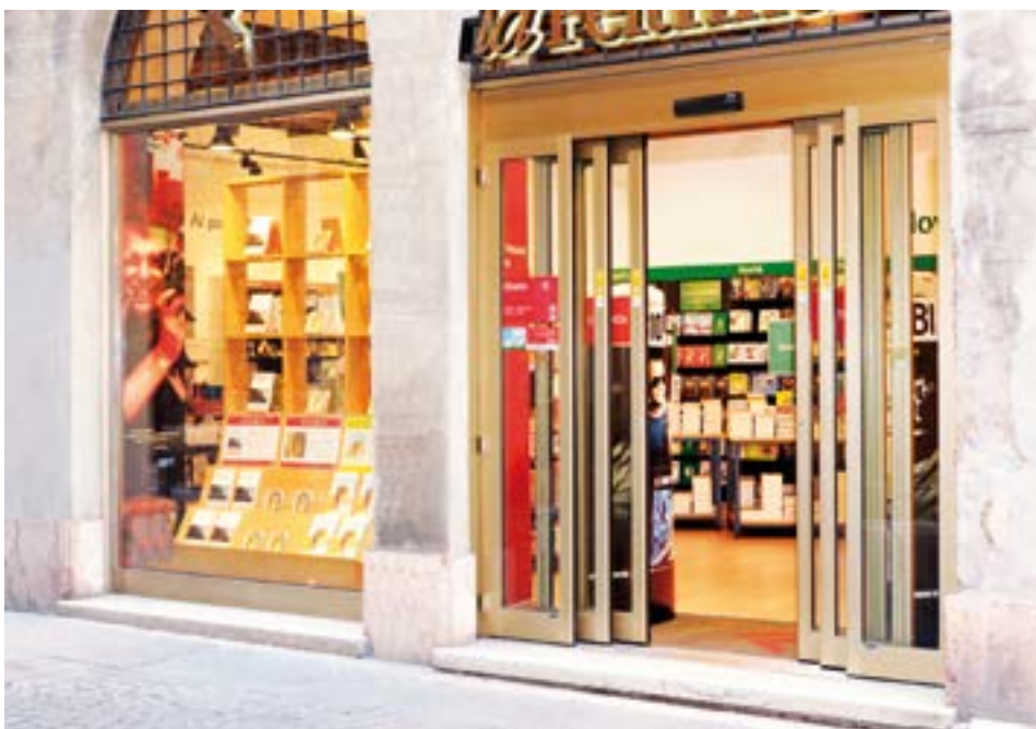
Porta telescopica Bilateral ingresso facilitato per clienti e merci per negozi - Retail GDO