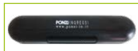
Sensore combinato sicurezza e movimento