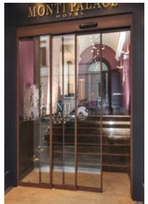
Porta telescopica ante con profili a tenuta "Slim" 20 mm

— | LA SOLUZIONE OTTIMALE PER AMPI PASSAGGI | —