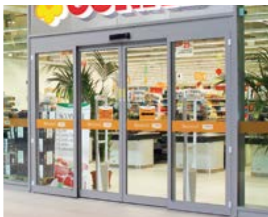
Automazione AS4 per centro commerciale in parete vetrata