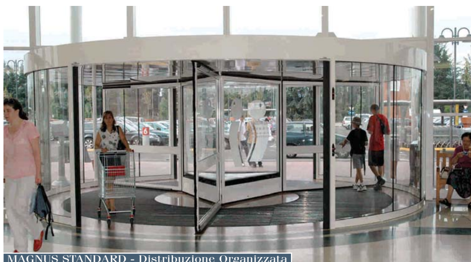
MAGNUS STANDARD - Distribuzione Organizzata

Il Magnus nella versione Standard è costituito da tre o quattro ante mobili rotanti attorno ad un asse centrale.