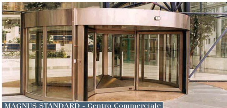
MAGNUS STANDARD - Centro Commerciale