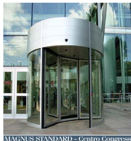
MAGNUS STANDARD - Centro Congressi