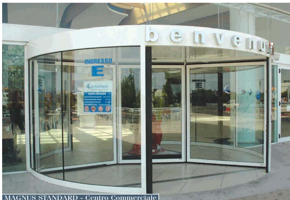
MAGNUS STANDARD - Centro Commerciale