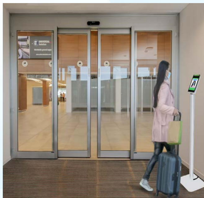
Termocamera PONZI RFT installata su apposita colonnina. Collegata a bussola d'ingresso.